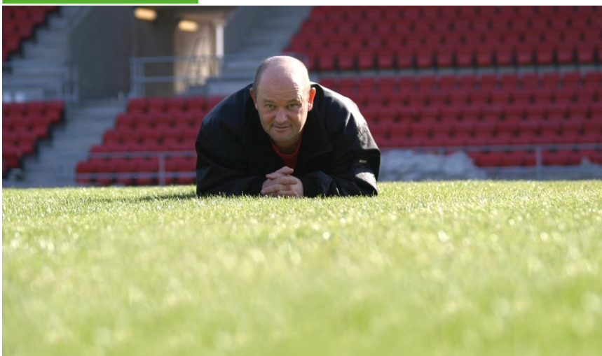
Fredrikstad stadion, etter gresset ble installert våren 2007